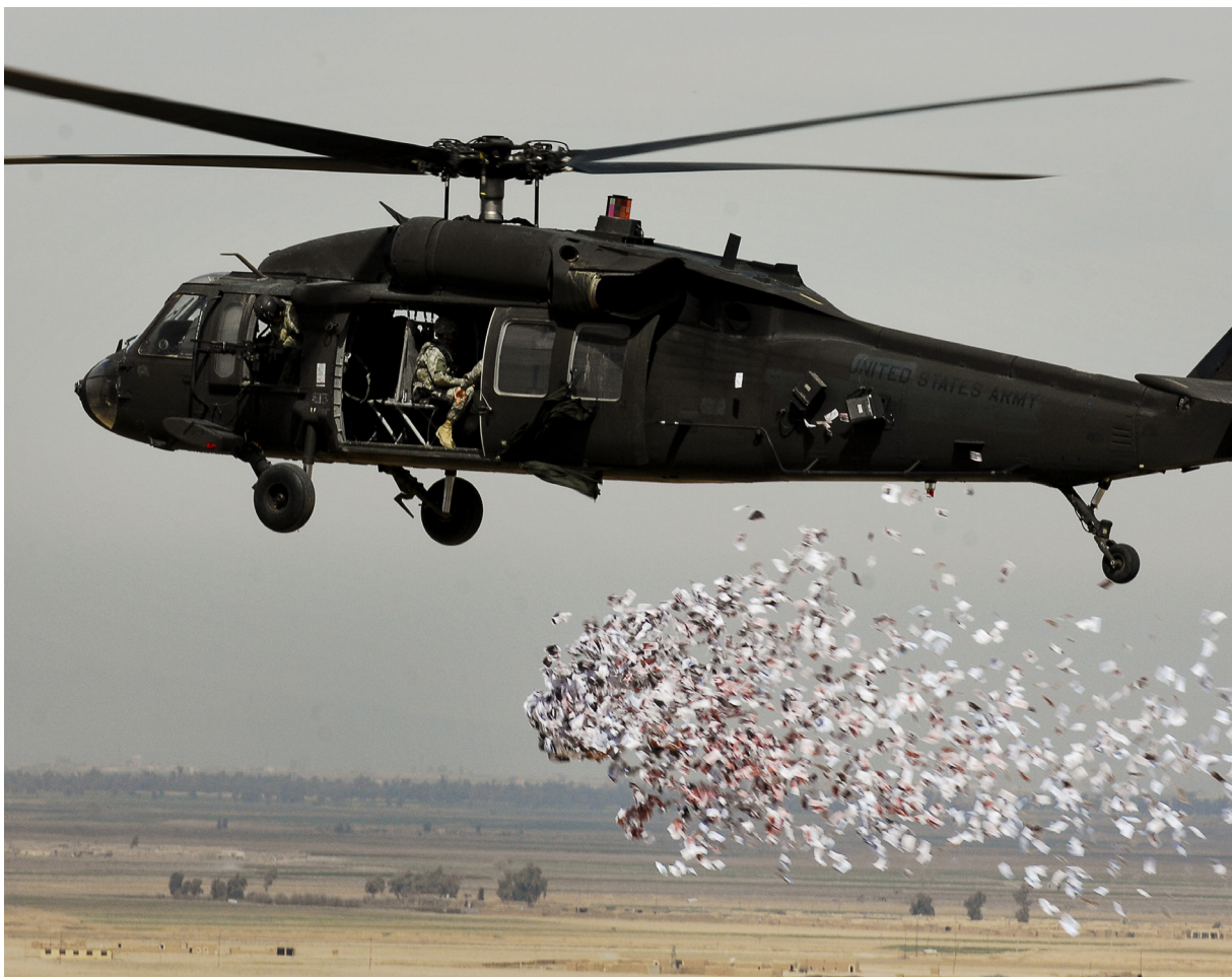
Udfordringerne fra onlineradikalisme og voldsforherligende propaganda kan ikke blot forstås som et strategispil, og modnarrativer kan ikke smides som informationsbomber på de sociale medier. Foto: Amerikanske soldater smider pamfletter over en irakisk landsby i 2008.

Den anden problematiske metafor, markedsmetaforen, er grundlagt på ideen om, at man kan sælge de unge mennesker et bedre alternativ til eksempelvis islamisme eller den militante jihadisme. Her tænkes identitet og politisk ståsted som et spørgsmål om udbud og efterspørgsel, og unge