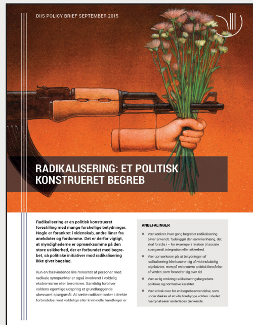
Læs mere om radikaliserings i de to policy briefs fra 2015 Kampen mod online radikaliserings starter offline og Radikaliserings: Et politisk konstrueret begreb af Tobias Gemmerli,

Tobias Gemmerli, cand.scient.pol., International Sikkerhed (toge@diis.dk) .