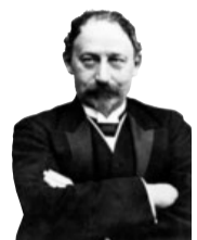
EDVARD BRANDES (1847-1931) STIFTER AF POLITIKEN I 1884