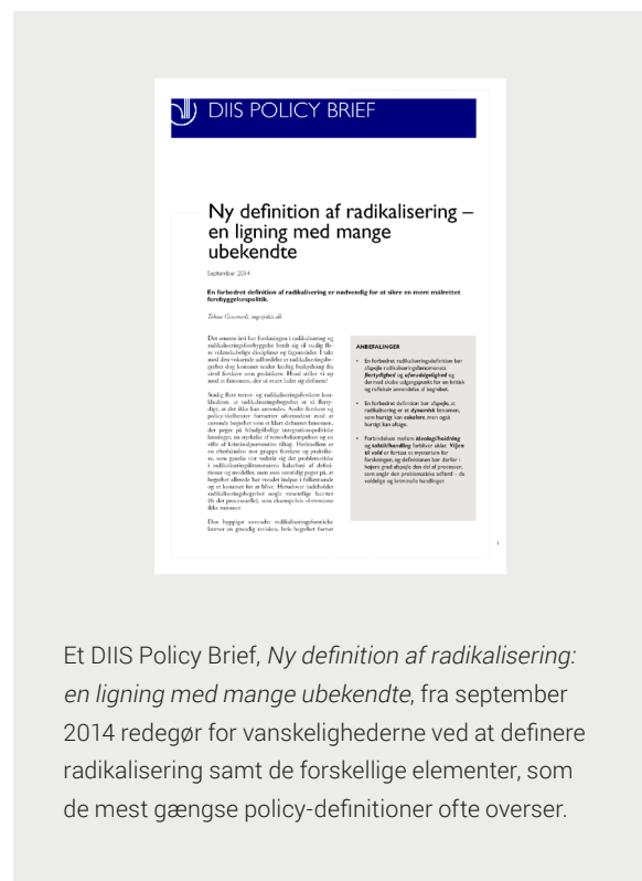
Et DIIS Policy Brief, Ny definition af radikalisering: en ligning med mange ubekendte , fra september 2014 redegør for vanskelighederne ved at definere radikaliseringsproces samt de forskellige elementer, som de mest gængse policy-definitioner ofte overser.

"...en proces, hvori en person i stigende grad accepterer anvendelse af udemokratiske eller voldelige midler, herunder terror, i et forsøg på at opnå et bestemt politisk/ideologisk mål."